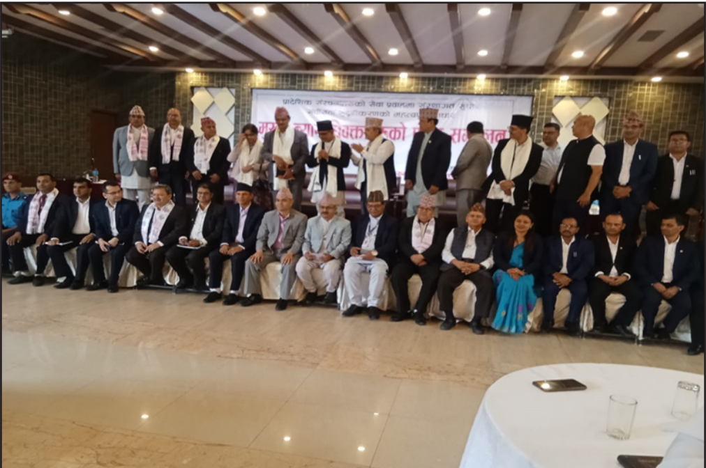
मुख्य न्यायाधिवक्ताको सम्मेलन कार्यक्रम बागमती प्रदेश हटौडाको झलक ।