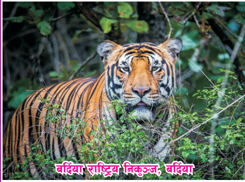
बर्दिया राष्ट्रिय निकुञ्ज, बर्दिया