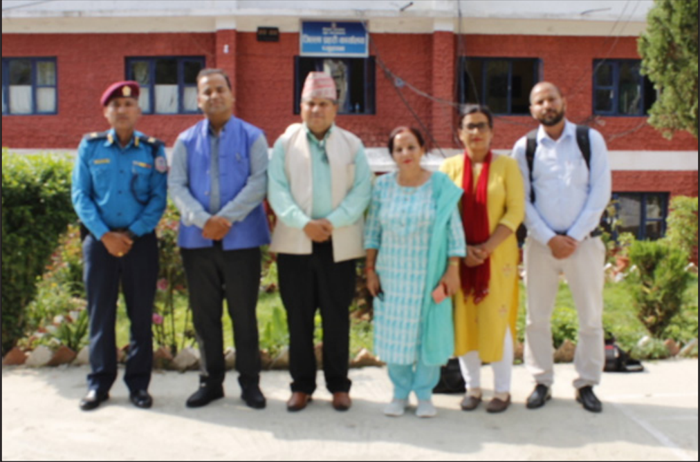
जिल्ला प्रहरी कार्यालय प्युठान ।