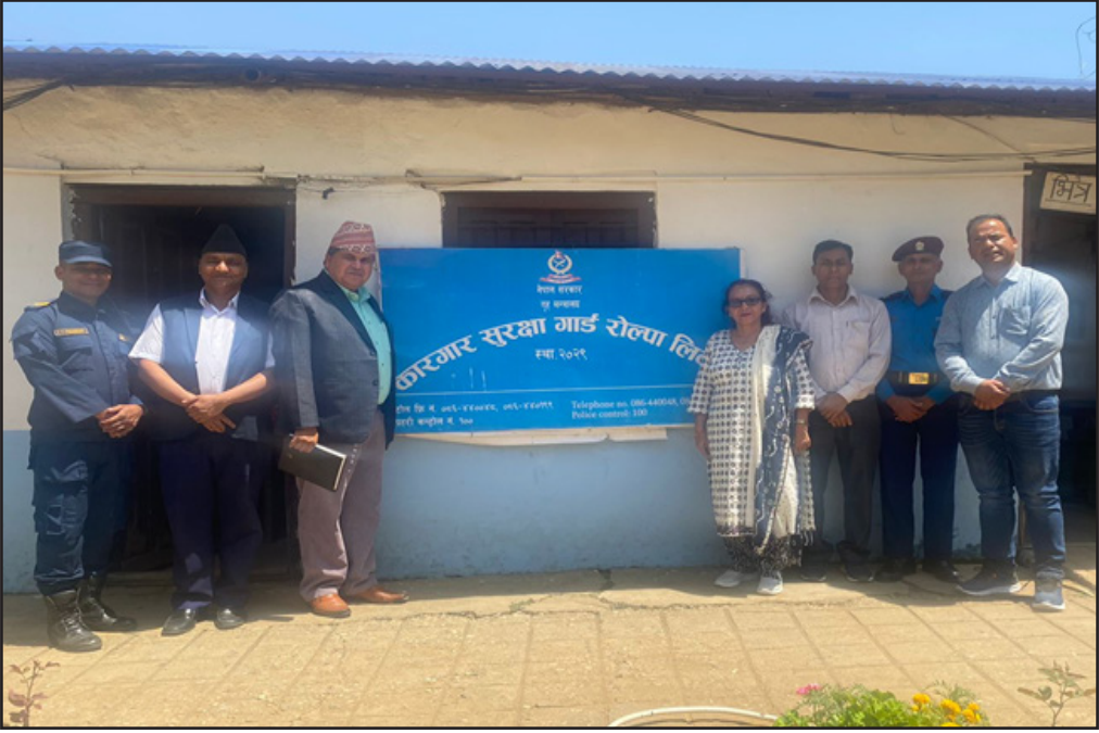
कार्यक्रम समापनपछिको सामुहिक तस्विर ।