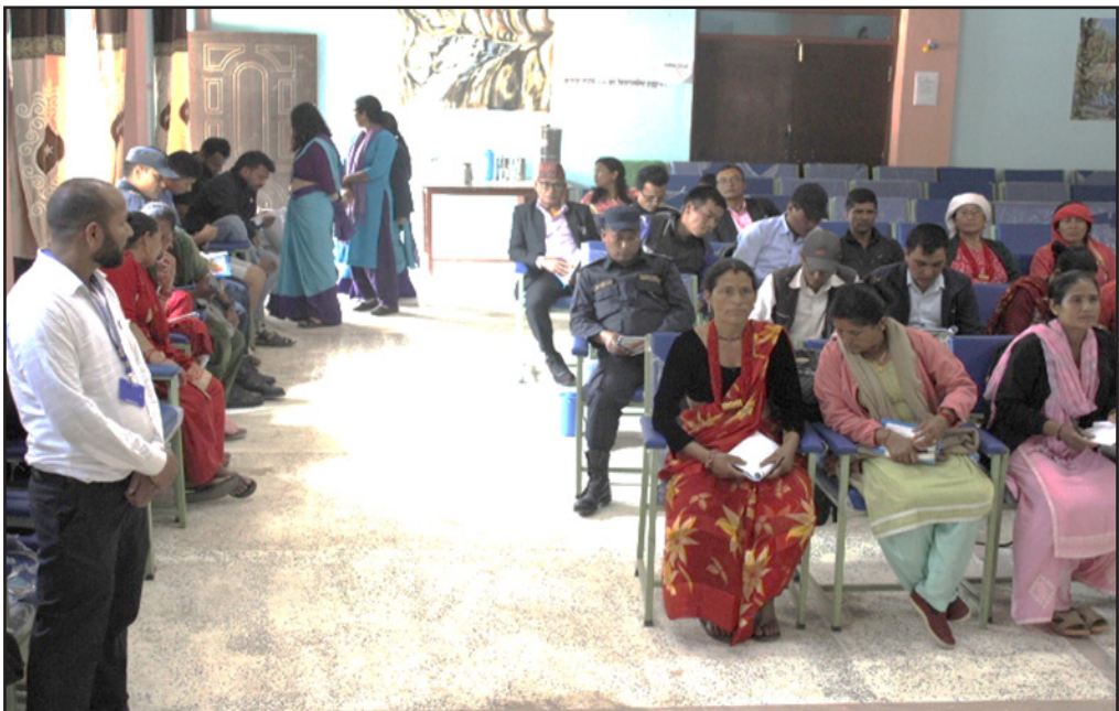
कार्यक्रमका सहभागीहरू प्रशिक्षण लिँदै ।