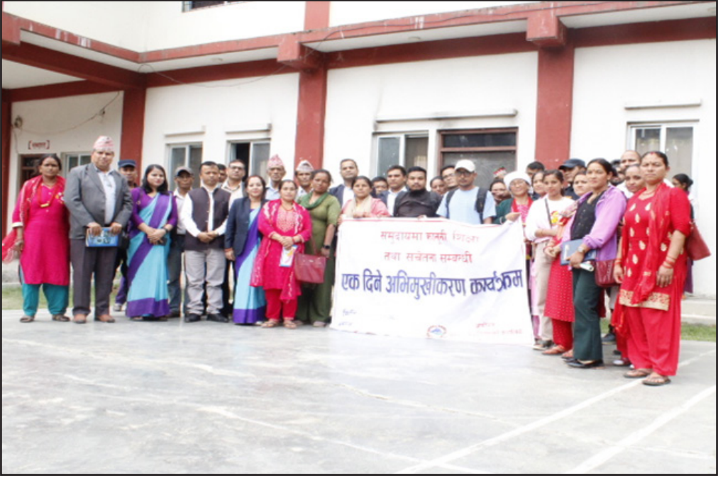
कार्यक्रम समापनपछिको सामुहिक तस्विर ।