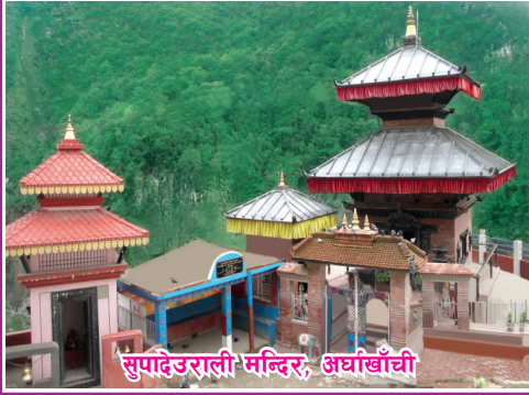
सुपदेउराली मन्दिर, अर्घाखाँची