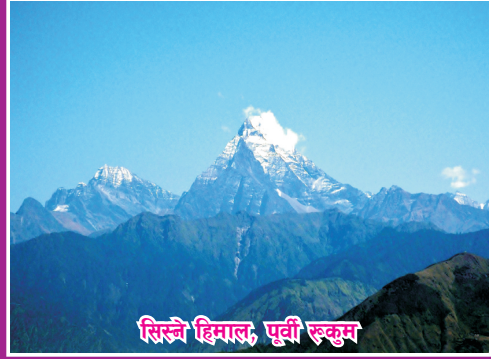
सिस्ने हिमाल, पूर्वी रुकुम