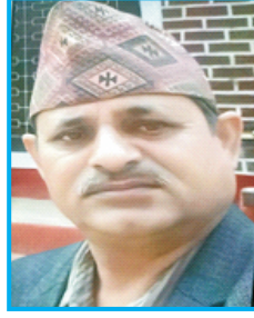
यमलाल खनाल मुख्य न्यायाधिवक्ता