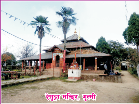
रेसुवा मन्दिर, गुल्मी