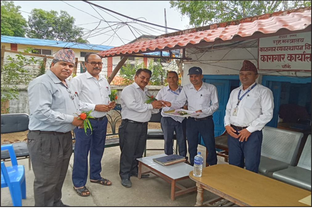
कारागार कार्यालय नेपालगंज बाँके ।