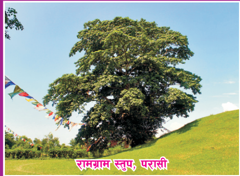
रामग्राम स्तुप, परासी