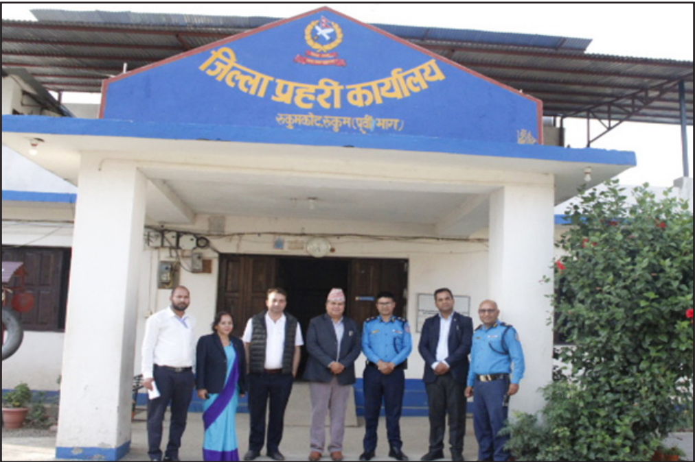
जिल्ला प्रहरी कार्यालय रुकुम पूर्वको हिरासत निरिक्षणको क्रममा ।