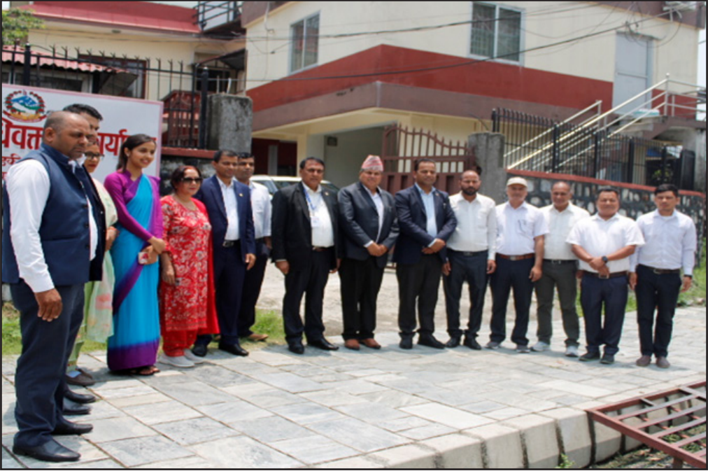
गण्डकी प्रदेश मुख्य न्यायाधिवक्ताको कार्यालय पोखरामा अनुभव आदान प्रदान कार्यक्रमको झलक ।